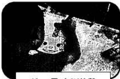
グニャ風づくり体験