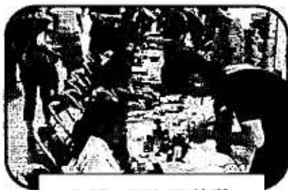
レーザークラフト体験