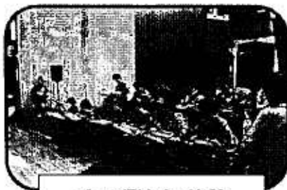
大正琴演奏・体験