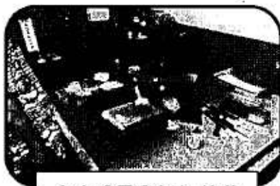
名古屋扇子実演・体験