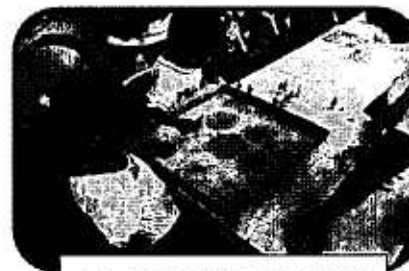
名古屋友禅実演・体験