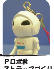
Pロボ君 ストラップづくり