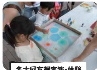
名古屋友禅実演・体験