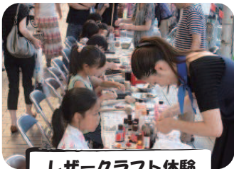
レーザークラフト体験