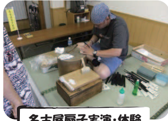
名古屋扇子実演・体験