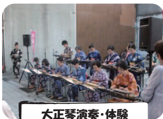
大正琴演奏・体験