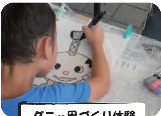
グニャ凧づくり体験